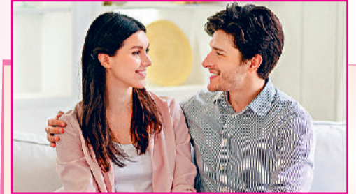
जीवन को थामे रखता है। वही प्रेम रिश्तों को टूटने से बचाता है, वही प्रेम जीवन को मानवीय बनाता है। और यही स्त्री मन का सबसे बड़ा अवदान है कि वह प्रेम को जीने की कला सिखाता है, बिना शर्त, बिना अपेक्षा, बस पूरी आत्मीयता के साथ।

प्रेम में त्याग करती है स्त्री: घर के भीतर हो या काम-काज में, स्त्री का प्रेम सबसे अधिक दिखाई देता है। सुबह की पहली चिंता से लेकर रात की आखिरी तैयारी तक, प्रत्येक काम में उसका प्रेम घुला-मिला होता है। वह भोजन बनाते समय यह सोचती है कि किससे क्या पसंद है, किससे क्या नहीं? वह बीमार सदस्य की नौद का ख्याल रखती है। बच्चों के डर को अपनी हिम्मत से निडर बनाने का प्रयत्न करती है। स्त्री मन का प्रेम त्याग से जुड़ा होता है फिर भी त्याग बोझ नहीं बनता। स्त्री इसे अपने अस्तित्व का हिस्सा बना लेती है।