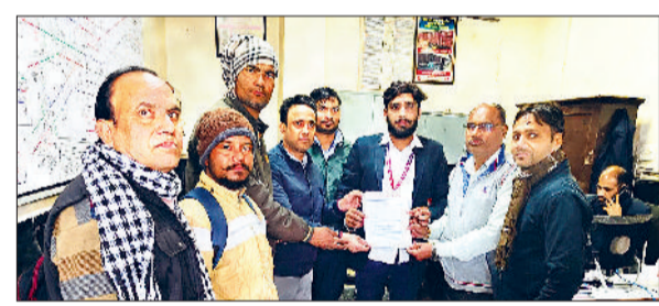
नारनौल। मांग पत्र सौंपते हुए दैनिक रेल यात्री संघ सदस्य।