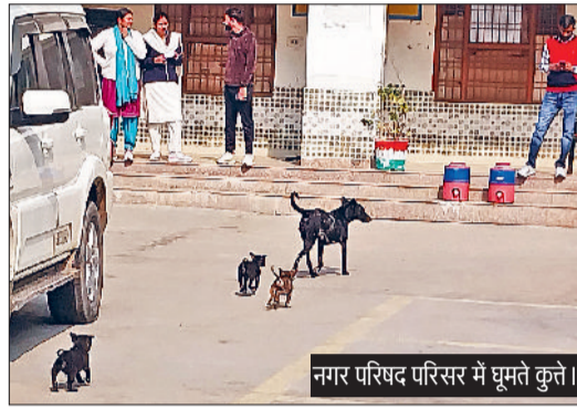
नगर परिषद परिसर में घूमते कुत्ते।