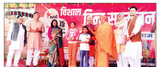
महेंद्रगढ़। हिंदू सम्मेलन में प्रतिभावन बच्चों सम्मानित करते हुए।

हिंदू समाज की सबसे बड़ी विशेषता है कि यहां पर भिन्न-भिन्न विचारों की समावेशन का सबसे बड़ी क्षमता है। सत्य तक पहुंचने के अनेक अलग-अलग रास्ते हैं। उन सभी रास्तों को स्वीकार करके सर्व हितकारी सर्व मंगलकारी जीवन जीने की पद्धति ही हिंदू समाज की पहचान है। अब अपनी इसी बड़ी पहचान को याद करके एकजुट होने का समय है। उक्त विचार ब्रह्मचारी