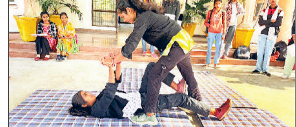
महेंद्रगढ़। कैंप के दौरान आत्मरक्षा के गुर सिखती छात्राएं।