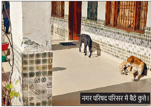
नगर परिषद परिसर में बेटे कुत्ते।

शहर में लगातार बढ़ रही आवारा कुत्तों की संख्या पर नियंत्रण के लिए नगर परिषद की ओर से करीब दो महीने पहले कुत्तों की नसबंदी व वैक्सिनेशन के लिए टेंडर किए गए, जिसके बाद टेंडर लेने वाली फर्म की ओर से कुत्तों को पकड़ने के कार्य में फ्रूटि दिखाई गई, लेकिन वर्तमान में से अभियान काफी धीमा हो गया है। नगर परिषद की ओर से जारी कार्यालय व एजेंसी हेल्पलाइन नंबर सेवा ही बीमार हो गई है। दोनों नंबरों पर कॉल रिसीव नहीं हो रही है। नगर परिषद परिसर में ही स्ट्रीट डॉग ने डेरा डाला हुआ है। नसबंदी का कार्य होने के बावजूद शहर में कुत्तों की तादाद बढ़ रही है। नप कार्यालय परिसर में कुत्तों के बच्चे देखे जा सकते हैं। नप की ओर से पिछले दिनों कुत्तों की नसबंदी करने का लक्ष्य है। फर्म की ओर से कुत्तों की नसबंदी और टीकाकरण की प्रक्रिया पूरी करने के बाद वापस उसी क्षेत्र में छोड़ा जा रहा है।