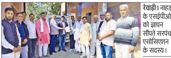
रेवाड़ी। नाहड़ के एसडीओ को ज्ञापन सौंपते सरपंच एसोसिएशन के सदस्य।

नाहड़ खंड सरपंच एसोसिएशन ने खंड विकास एवं पंचायत अधिकारी के माध्यम से जिला उपयुक्त को ज्ञापन भेजकर ग्राम सभा में ग्रामीणों की अनिवार्य 40 प्रतिशत भागीदारी को हटाने की मांग की है। दो दर्जन गांवों के सरपंचों ने कहा कि ग्राम पंचायतों में ग्राम सभा करने के लिए 40 प्रतिशत ग्रामीणों की अनिवार्य भागीदारी संधी पंचायतों के लिए बहुत बड़ी चुनौती बन गई है। ब्लॉक की पंचायतों में लगभग सभी सरपंच चौकीदार से मनादी करारक तीन ग्रामसभा का आयोजन