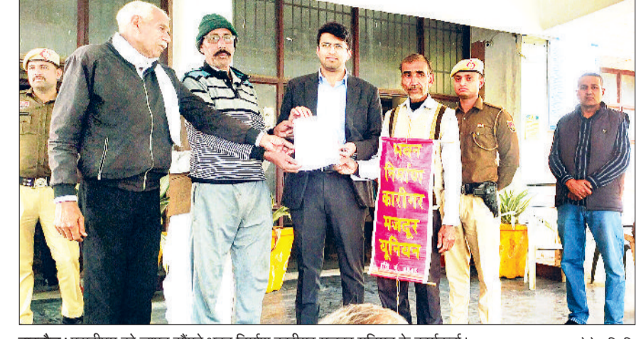
नारनौल। एसडीएम को ज्ञापन सौंपते भवन निर्माण कारीगर मजदूर यूनियन के कार्यकर्ता।