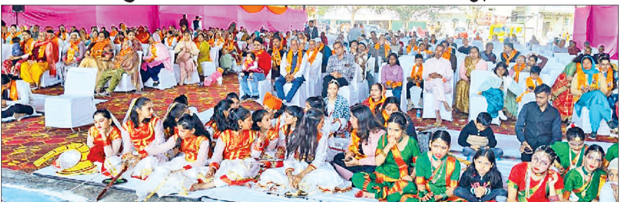
रेवाड़ी। हिंदू सम्मेलन में मौजूद अतिथिगण, बच्चे व संगठनों के सदस्य।